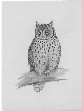
【上】野鳥図鑑用挿絵 トラフズク (小林重三 作・個人蔵) 【左】野鳥図鑑用挿絵(小林重三 作・個人蔵)